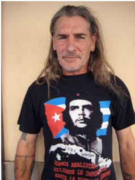
LDD1 : Série ExPOCHETTES

Après presque 2 années d'exPOCHETTES (À raison d'une par semaine) au Baratcho, j'ai demandé aux exposants mâles de laisser un souvenir. Quelqu'un a proposé de reprendre la célèbre pochette des Rolling Stones « Sticky Fingers » imaginé par Wahrol. La pochette étant, à taille « un », il suffisait de bien se caler pour donner l'impression d'avoir un jean's. Le photographe Jean-Marc Balsière était là et a accepté ce projet. Le meilleur dans cet exercice reste Tcho!