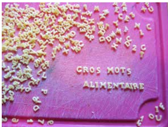
LDD3 : Série Patasoupes Copyright : Pascal Granger

LES PATASOUPES : Je me prépare parfois des soupes avec du bouillon Kub et des alphabets Panzani. Alors, comme tout le monde j'ai recréé l'imprimerie avec la typographie soupière ..... !