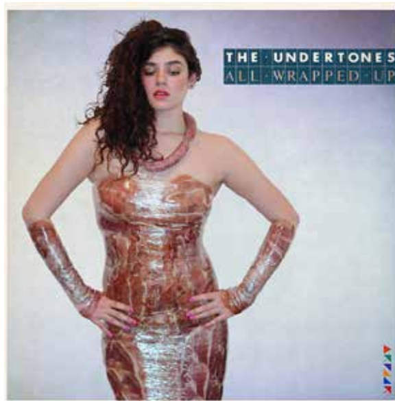
LDD5 : Série «Toutes emballées»

BBR : Après les attentats, certains balcons sétois se sont parés de drapeaux français. J'étendais mon linge et soudain, mes gants de toilettes étaient dans l'ordre des trois couleurs sur le fil de l'étendoir. Une nouvelle série était née : les objets, les personnes, les voitures et diverses choses ordonnées (naturellement) comme les trois couleurs du pavillon national.