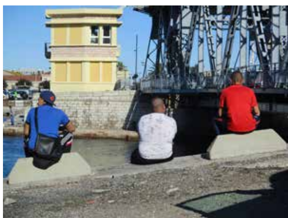
LDD4 : Série BBR

LES PATASOUPES : Je me prépare parfois des soupes avec du bouillon Kub et des alphabets Panzani. Alors, comme tout le monde j'ai recréé l'imprimerie avec la typographie soupière ..... !